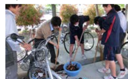
2 年 クリーンスクール