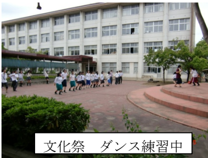
文化祭 ダンス練習中

一人でも多くの方に来ていただき、長野南高校をもっと知ってもらい、一緒に盛り上げたいです。