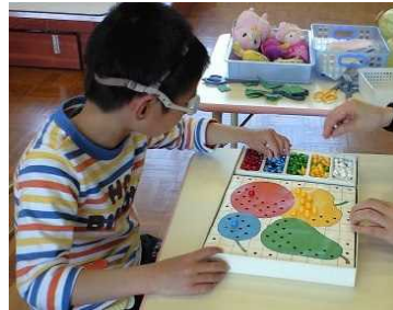
【小さな物をよく見てつまむ】