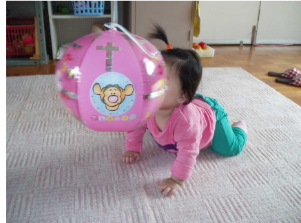
【体全体で確かめます】

早い時期から保有する視機能や諸感覚の活用を促すことが大切です。遊びを通して見る力、触って理解する力、環境把握する力などを高めます。一緒に子育てについて考えます。