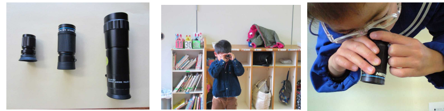
【遠くを正確に見るために～遠用弱視レンズ練習】