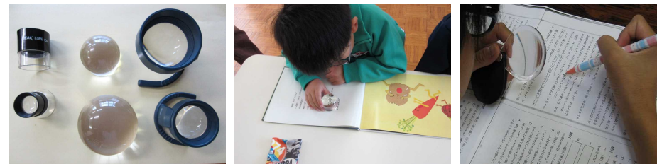
【近くを正確に見るために～近用弱視レンズ練習】

通常の学校に通う視覚障がい児童・生徒が盲学校に定期的に通学して弱視レンズ（ルーペ、単眼鏡）等の習熟を高め、教科の補充学習を行います。