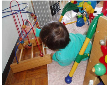
【近づいて手を伸ばして】