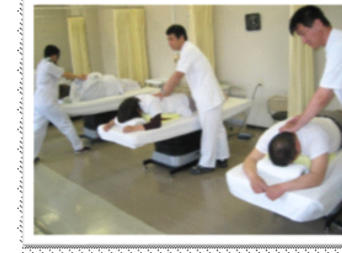
【あん摩実習の授業】

盲学校では3年間であん摩マッサージ指圧師、はり師、きゅう師の国家資格の取得を目指す課程「理療科」があります。見えにくさがあって就職等でお困りな方、または進学で悩まれている方など、相談ください。