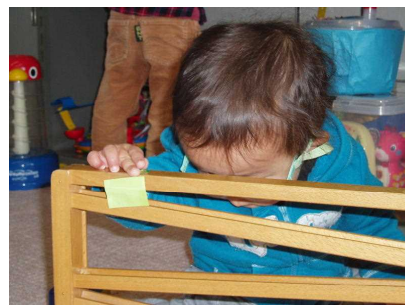
【動く物を目で追って】