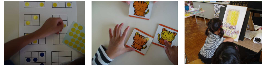
【位置の理解、違いに気づく力、効率の良い目の使い方】