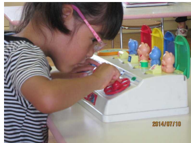
【見える所まで目を近づけて】

「よく見て理解する力」、「手で操作する力」、「書く力」、「違いに気づく力」、「位置関係の理解」、「効率の良い目の使い方」等を学びます。幼稚園・保育園に在籍しながら教育相談をうけることができます。