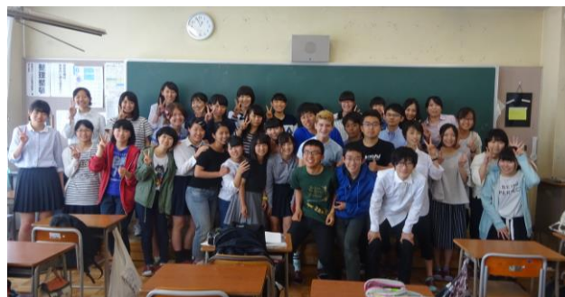
3年7組の生徒たちと