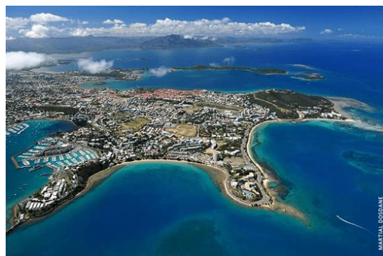
ニューカレドニア