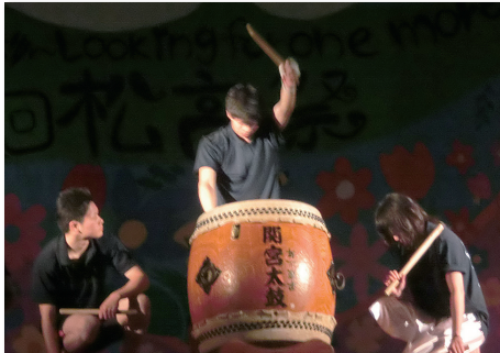
オープニング 関宮太鼓 「決まった！」