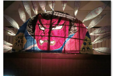
迫力満点！ “ねぶた”全校制作