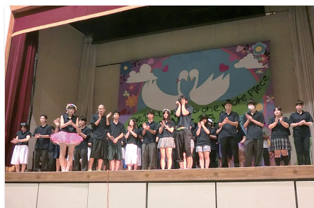
後夜祭 役員あいさつ 全校から拍手喝采… “ありがとう！！”