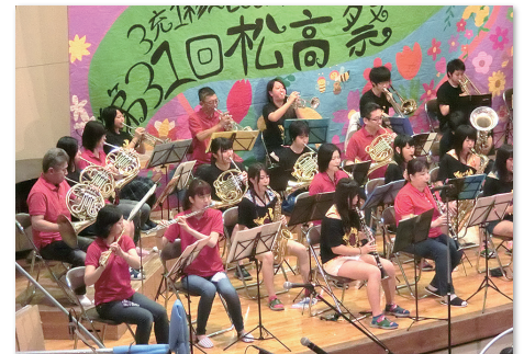
初企画！！ 松川吹奏楽団×松高吹奏楽部