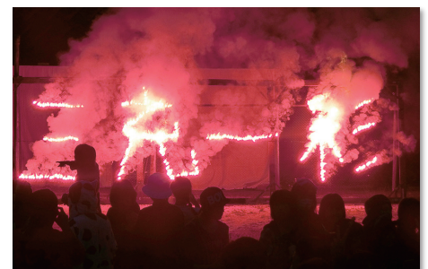
火文字(三充一彩)に込めた 全校の“熱い思い”がひとつに！