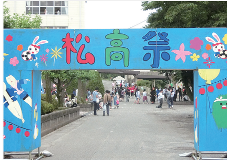
松高祭 伝統の “ウエルカムアーチ”