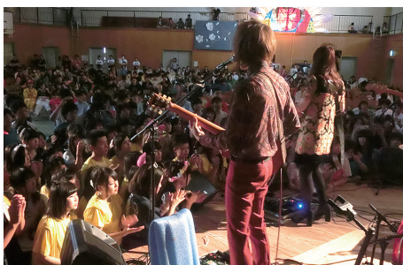
講演会(ライブ)本校卒業生 スペシャルゲスト GLIM SPANKY