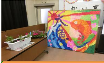
全校制作「モザイクアート」贈呈