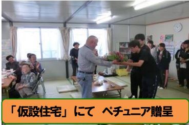
「仮設住宅」にて ペチュニア贈呈