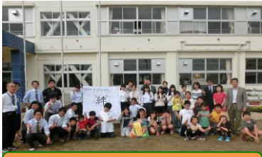
がんばれ！ 湊(湊第二)小学校