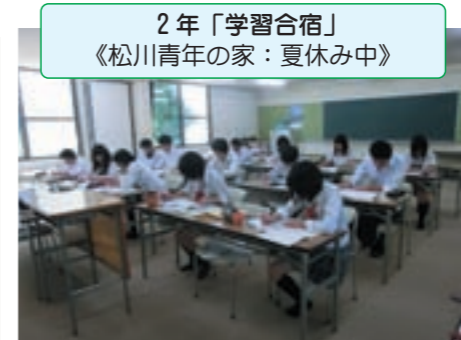
2年「学習合宿」 《松川青年の家:夏休み中》