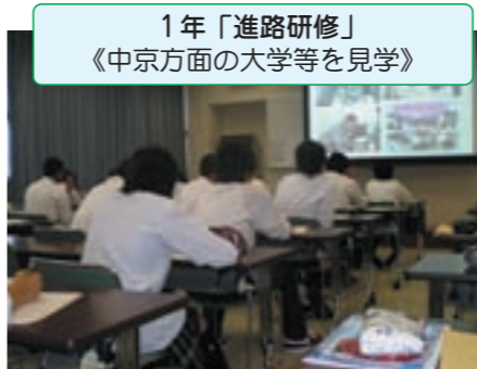
1年「進路研修」 《中京方面の大学等を見学》