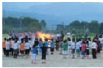
ファイアーストーム