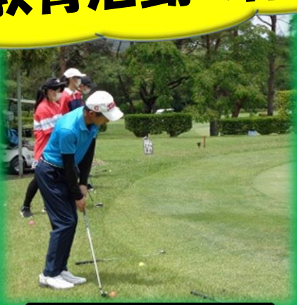
キャリア授業（ゴルフ）