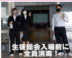
生徒総会入場前に 全員消毒！