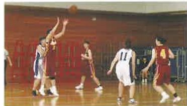
女子バスケットボール