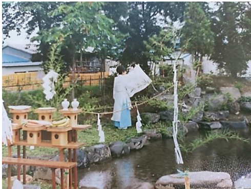
のりこの池・築山の建設