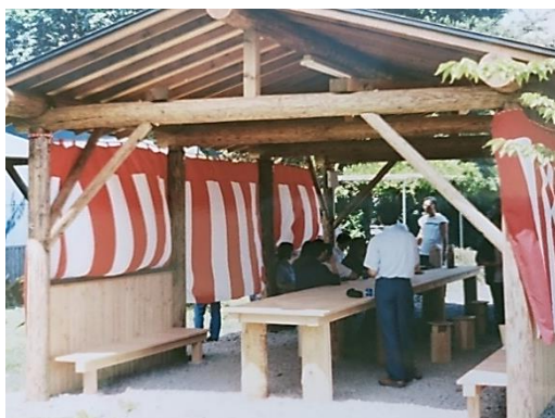
第 2 東屋 完成