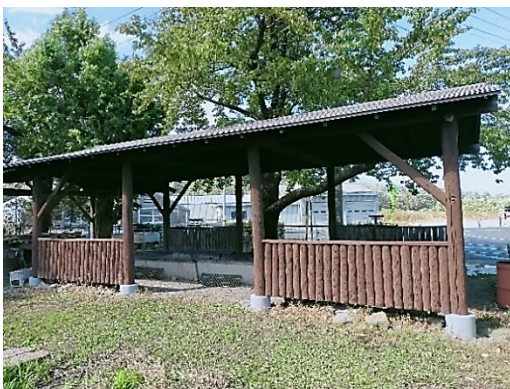
東屋の土台の補強工事