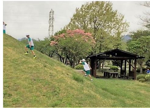
こどもたちが大好きな冒険の丘