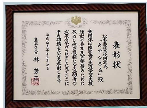
同窓会が文部科学大臣賞を受賞（平成 29 年）