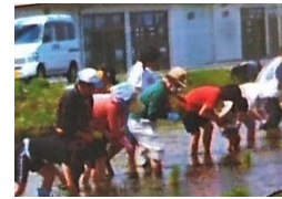
P T A で米作り

○平成 28 年 中信地区特別支援学校再編により、松本盲学校に高等部分教室とひだまり教室開室