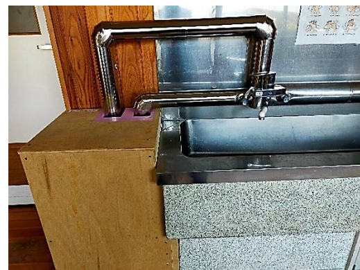
プレイルーム横の水道に温水器設置