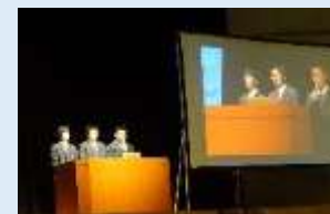
産社・CS合同発表会