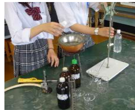
サイエンスアカデミー系列 理科・数学分野