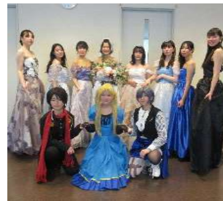
芸術デザイン系列 被服・芸術分野