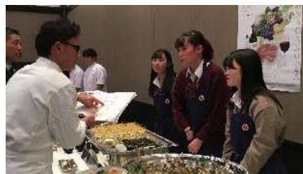
スポーツ健康系列 保健体育・福祉・家庭分野