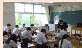
講座別少人数学習