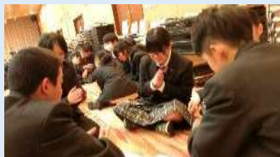
コミュニケーションキャンプ