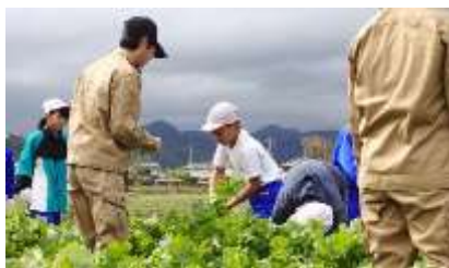
バイオ・環境テクノ系列 農業・工業分野