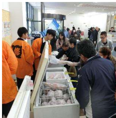
情報ビジネス系列 商業・情報分野