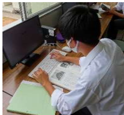
文化アカデミー系列 国語・地歴公民・外国語分野

丸子修学館で学ぶことのできる講座は、6系列14分野に分けられます。たくさんの講座から自分の進路や関心に関する講座を選び、学ぶことができるのが丸子修学館の特徴です。