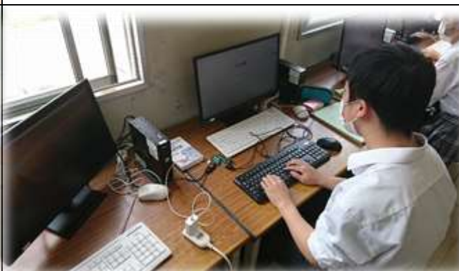
【総合研究】 自作のラズパイでプログラム作成