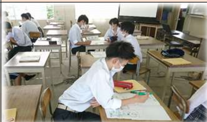
【マーケティング】 新しいコンビニの企画案作成