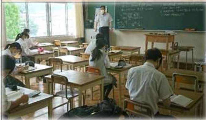
【財務会計】 株式会社の決算書類に関する学習