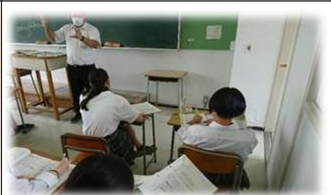
【ビジネス経済】 「供給」の学習、生徒も真剣です

簿記検定取得だけでなく、会計思考を身につけることで「本質を見る目」を養っていきます