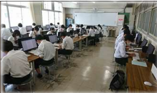
【文書処理】 ビジネス文書の作成実習のようす

商業の授業は2年次・3年次に選択 商業分野の開講講座 簿記・原価計算・財務会計1・管理会計 マーケティング・ビジネス経済 経済活動と法・情報処理・ビジネス情報 ビジネス実務・文書処理