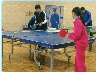
中学生対象卓球教室