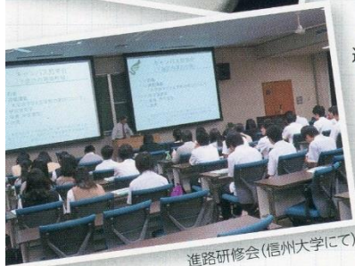
進路研修会(信州大学にて)