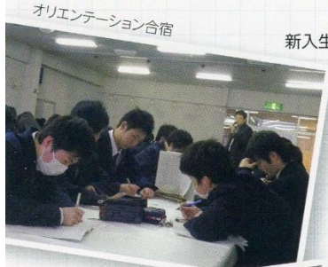
オリエンテーション合宿