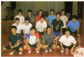
男子バドミントン部