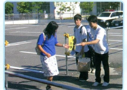
非行防止街頭啓発運動