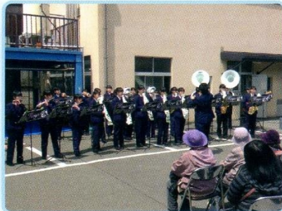
地域のお祭り（三角八丁）での吹奏楽部演奏