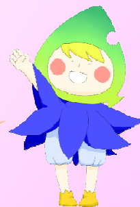
小海高校イメージキャラクター 『パクム』

生徒一人ひとりが手帳を使った学校生活を送っています。テスト勉強も計画的に進めるようにしています。