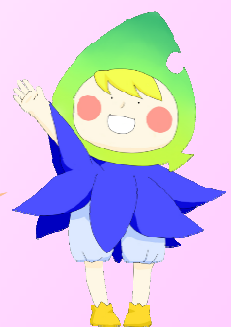
小海高校イメージキャラクター 『パクム』

友達や家族との関わりはこれからも大切です。お互いに助け合い、安心した生活が送れるよう心がけましょう！