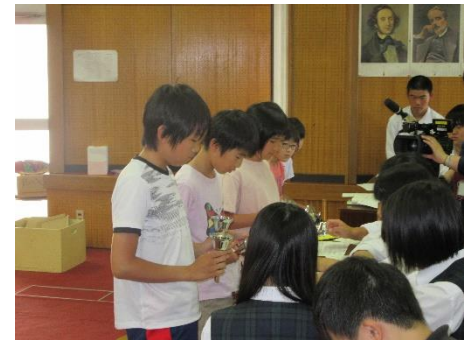
音楽の授業を体験 お兄さんやお姉さんといっしょにハンドベルでリズムにあわせて演奏しました。