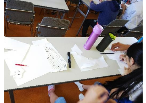
美術の授業を高校生といっしょに「ちぎって渡して書いてみよう」をやりました。楽しい授業になりました。