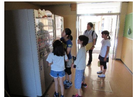
高校生の授業や施設を見学。小海高校のお姉さんに質問をしました。