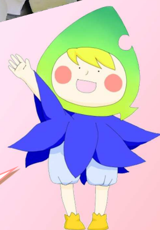
小海高校イメージキャラクター 『パコム』

各学年、色々な工夫を凝らした展示物や体験ができる発表で、とても面白かったよ。 模擬店は、みんな美味いって評判だったよ。