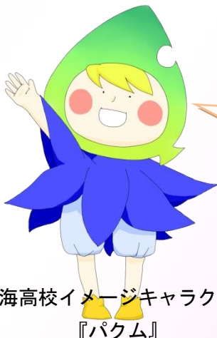
小海高校イメージキャラクター 『パカム』