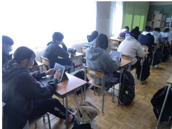
タブレットでアンケートを入力