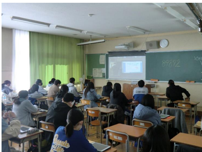
配信される発表を真剣に聞く生徒