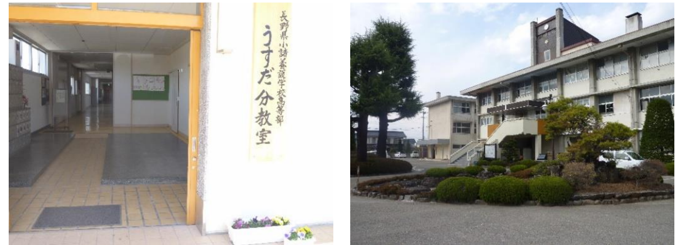
平成26年4月 臼田高校内(現：佐久平総合技術高校 臼田キャンパス内(北校舎)に開室