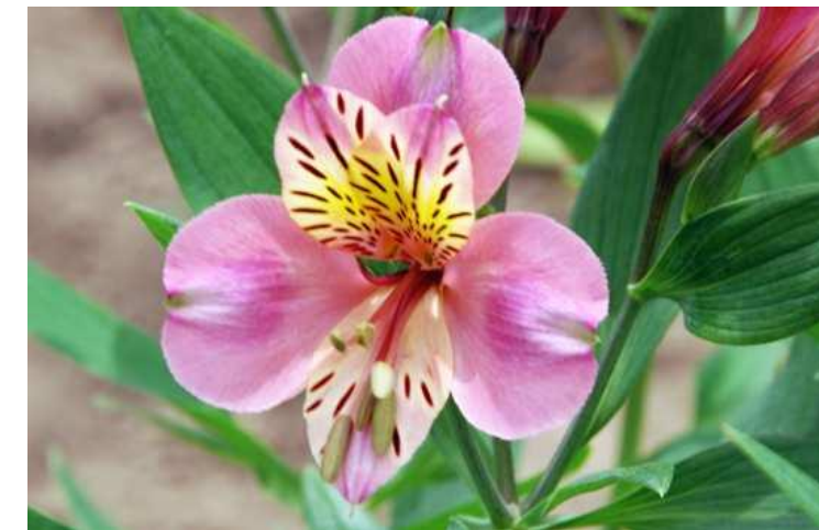
～ 分教室名の由来 ～

“花の町”佐久穂町の代表的な花である「アルストロメリア」の別名「夢百合草」から引用し、「ゆめゆりの丘」と名付けられました。