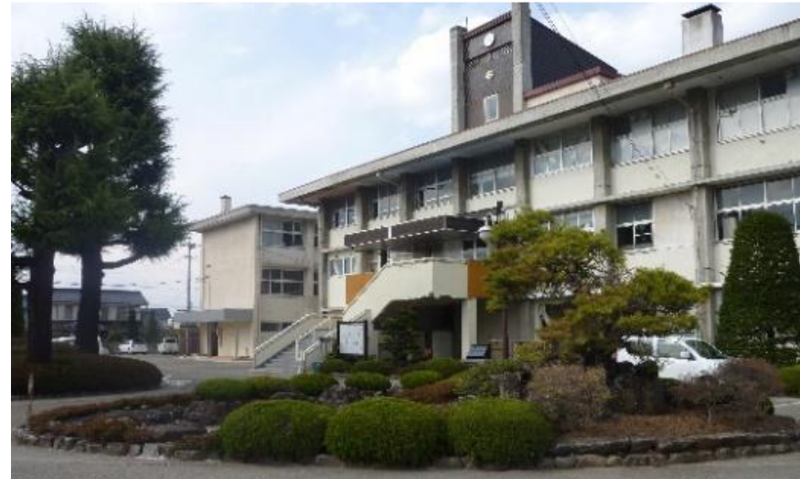
平成26年4月 白田高校内(現:佐久平総合技術高校 白田キャンパス内(北校舎)に開室