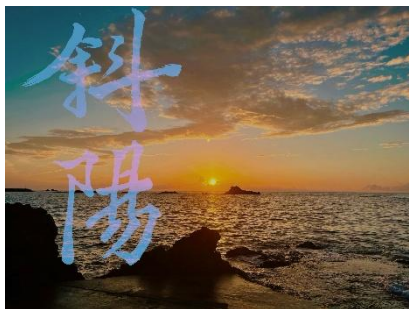
書道「楽しい書道」デジタル書道作品