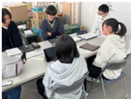
商工会議所で取り組む

10月保護者懇談会の最中に1年生はシオジリ学のフィールドワークに出掛け、塩尻市役所やNPO法人、観光協会へ出向き、グループ毎のミッションクリアに向けてプレゼンテーションおよび意見聴取を行いました。