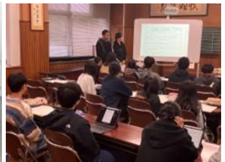
代表者が会議室で発表