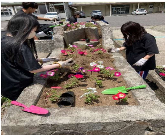
実施中（花壇苗の定植）