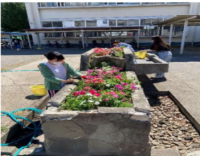
実施後（夏花壇の完成）