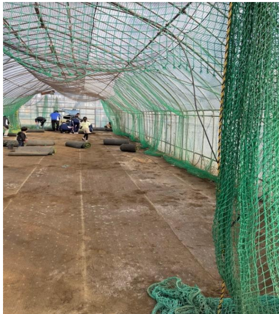
人工芝張り付け作業