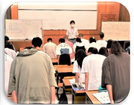
3 学年 面接マナー講座

2年次の終わり頃からは「総合研究」に取り組みます。総合研究では自分が選択した学問分野に関して研究テーマを決め、1年を通して調査・研究を進めていきます。毎年1月には総合研究発表会が開催され、全校生徒の前で代表者が研究の成果を発表します。