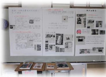
2年生は研修旅行先について調べて展示