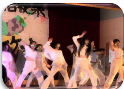
ダンス部は迫力のある踊りを披露