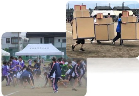
熱戦が繰り広げられた芋リンピック