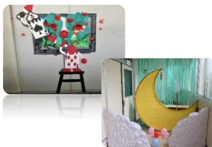
運動部はフォトスポットを作成