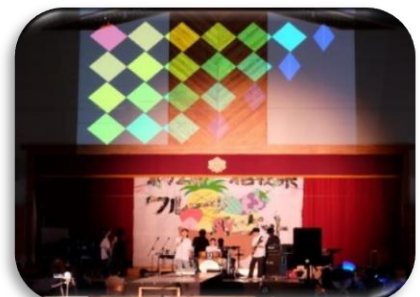
後夜祭も盛り上がりました