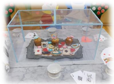
食物部は絵本に登場するお菓子を再現