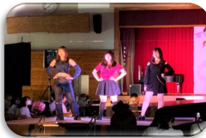
被服部によるファッションショー