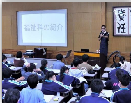
1 学年 専門教科模擬授業