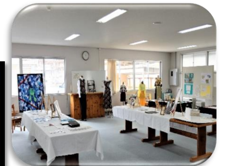
制作された作品も展示されました