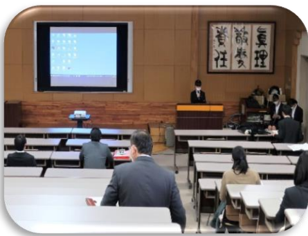
昨年度の発表会は事前に録画された発表映像を全校で視聴しました

上記のような活動を通して、塩尻志学館高校の生徒たちは自分で考え・選択し、学問や社会について多くのことを学んでいくのです。