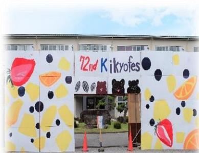
フルーツが描かれた校門のアーチ