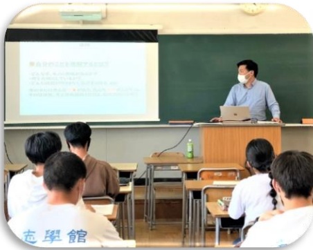
2 学年 分野別学習

塩尻志学館高校には、総合学科独自の授業があります。1年次では「産業社会と人間」という科目を学習します。この授業では、講義や講演会・ワークショップ、またグループでの活動などを通して社会生活や職業について学びながら自分の将来の生き方や進路について考えます。また、学問分野や系統別の説明を聞いたり模擬授業を受けたりして、2年次以降にどのような科目を選択するかを決めていきます。2年次では「キャリアプランニング」、3年次には「キャリアデザイン」という科目があり、自分の進路や職業についての理解や考えを深めていきます。このように、本校ではキャリア教育を重視した授業を行っています。