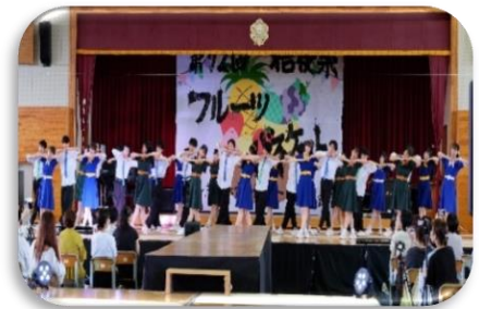
3年生のクラスダンス