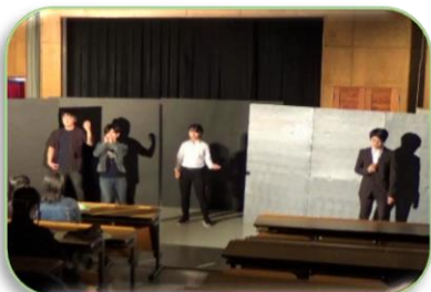
演劇部による舞台『未完成最高曲』