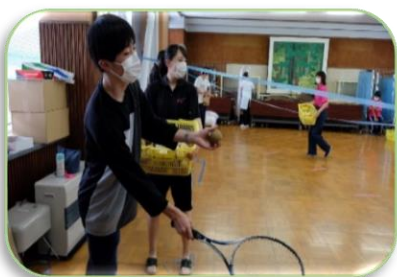
ソフトテニス部のテニス体験「Time Bingo」