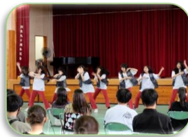
見ごたえのあるダンス部の発表