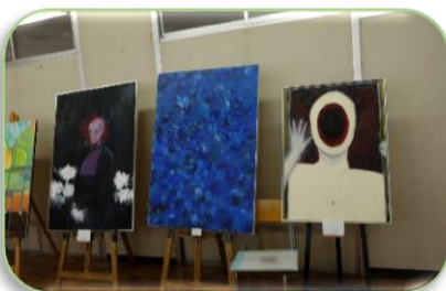
美術部は力作を展示