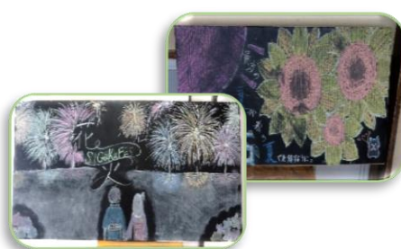
各クラスによる黒板アート