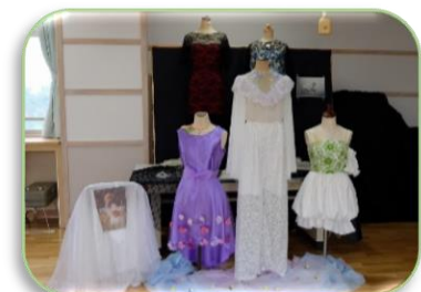
丁寧に製作された被服部の作品