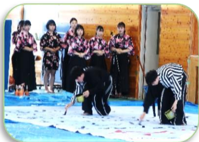
気合の入った書道部のパフォーマンス