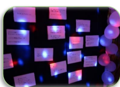
生徒会企画 フォトスポット