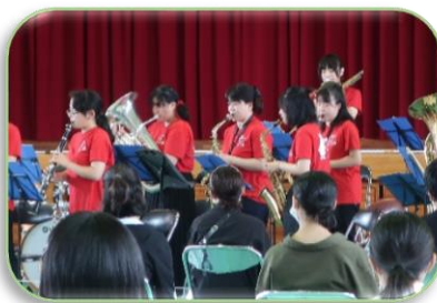
観客も楽しめた吹奏楽部の演奏