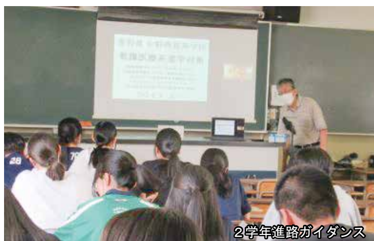
2学年進路ガイダンス