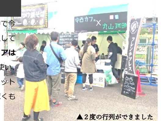
▲2度の行列ができました

今回の台風19号により、本校の生徒も大きな被害を受けました。復旧活動の中で今回のおごっそフェアを開催するかどうかという状況でしたが、イベントを通して「市民を元気に！」という主催側の思い出開催となりました。おごっそフェアは例年1万人以上の人々が訪れる大きな食のイベントです。信州中野産の食材を使い、ユニークな食べ物が多くどれも食べたくなるものばかり。。。シャインマスカット大福に、一度に6店の甘酒の飲み比べができるコーナーなど、どれも目を惹くものばかりでした。