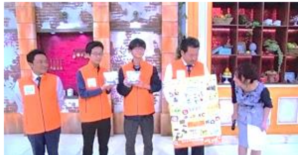
▲ゆうがた Get!に出演してきました

先日、3年生のコーヒー倶楽部メンバーの1人がAO受験を終えました。その際に、面接官の方からこの活動について質問があり、この活動に賛同し、是非うちの大学でも売ったらどうかとお話があったそうです。色々な広がり、つながりをもたらしています。