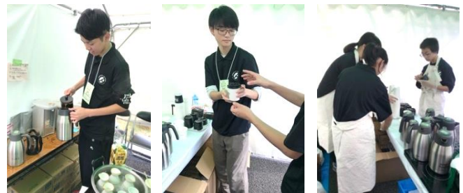
▲プロ顔負けのバリスタ達

今回、初めて参加した1年生も、皆、疲れたと言わずに自ら動いて黙々とコーヒーを作る姿は「バリスタ」そのものでした。会計や宣伝担当も、今回の我々のミッションである、1万人越えの来場者に広く多くチラシを配り、活動を知ってもらうことに大きく貢献してくれました。販売予定の300杯とチラシ200枚を配りきることができました。