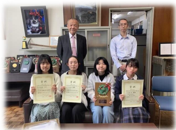
優勝報告をする女子将棋部の皆さん