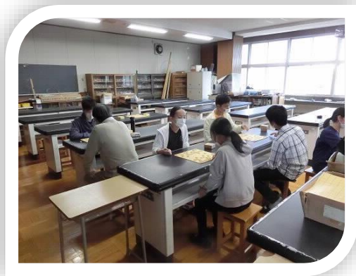
新入生を迎えて活気ある練習をする将棋部