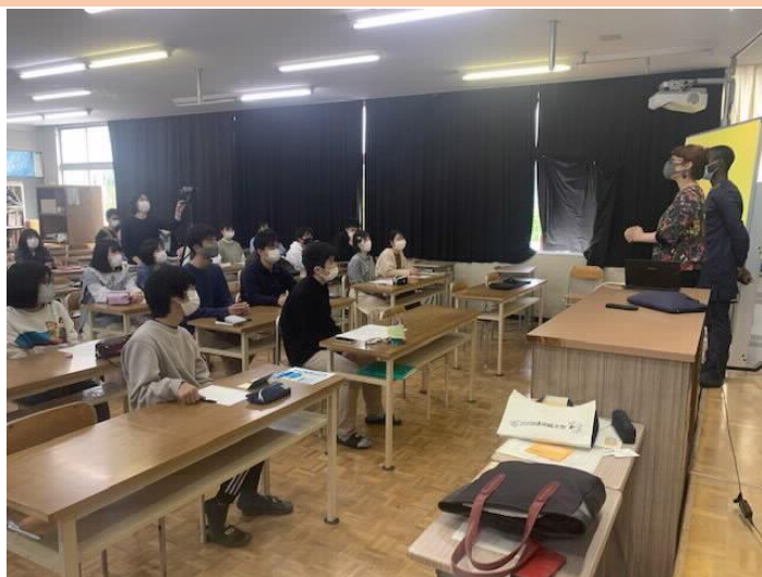
英語で講義を聴き、質問しようという有志諸君