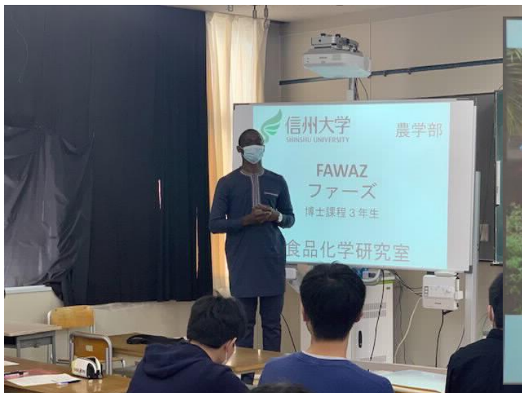
講師、ベナン共和国出身のファーズ先生

各グループ内の発表に続いて、食品ロスを防ぐ意思を示す My Pledge(私の誓い)が読み上げられました。