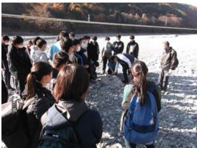
河川敷での岩石の観察