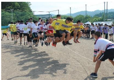
▲みんなでジャンプ!大縄飛び

8日は開催式に続いて「クラス発表」が行われ、クラスごとにダンスや劇を披露しました。厳正な審査の結果、3年5組が大賞を獲得しました。夕方、涼しくなった時間をねらい、「体育祭」を行い、学年を越えた交流を深めました。