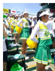
▲甲子園のために結成されたチアリーダー