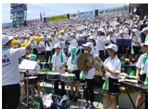
▲甲子園でも響いた飯高サウンド

8/4(日)、第59回長野県吹奏楽コンクール長野県大会・高校B編成の部(30人以下)に出場した吹奏楽部は、「鳥之石楠船神～吹奏楽と打楽器群のための神話」(曲:片岡寛晶)で最優秀賞(藤森章音楽賞)を獲得し、飯山北高時代の平成4年以来27年ぶりの東海大会出場をはたしました。今夏は野球部の応援や応援練習(県大会後半～甲子園)と並行するなかでの快挙となりました。