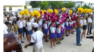
▲飯山チアリーダーチームチャーマーの子どもたちも出迎え