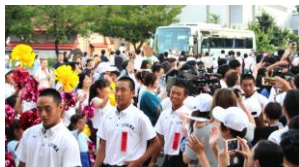
▲バスを降りた瞬間から大勢の市民らに取り囲まれる部員たち

8/10(土)夕刻、甲子園初出場をはたした野球部員らがバスで帰校しました。正面玄関前には生徒や学校関係者、市民ら約500名が出迎え、急遽編成された吹奏楽部の「Gフレア」(巨人軍チャンステーマ曲)の演奏にのせて声援を送りました。報告会で部員たちが整列すると、あちこちから「ありがとう」「よく頑張った」との声がかけられました。