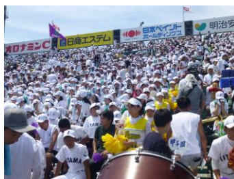
▲真っ白に埋めつくされたアルプス