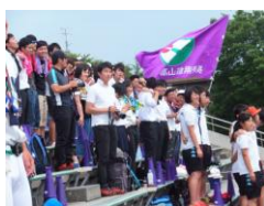
▲保護者・OB・在校生らも熱心に応援(上伊那農戦)