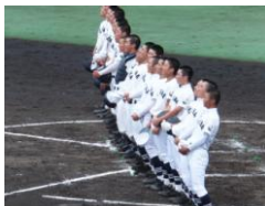
▲初戦の上田染谷丘戦に勝利し、校歌を歌う部員

「飯山から甲子園」の夢は叶いませんでしたが、さわやかな飯高旋風をまき起こしてくれました。