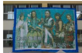
▲2500枚の折り紙で作成した巨大な全校壁画

完全統合して2回目となる「飯高祭」が6/30(金)～7/2(日)の3日間開催され、大雨警報が出る荒天のなか、のべ2596名の皆様に来校していただきました。今年のテーマは「HEROS～そして伝説へ～」。1日目は合唱祭・体育祭が行われましたが、合唱祭では混声四部合唱が増え、講師の先生方からも「ハーモニーのレベルが上がった」との評価をいただきました。体育祭は大玉送り・玉入れ・綱引きといった運動会種目がメインとなり、童心に返って楽しみました。2日目午前のパレマス(パレード&マスコット)は雨のため市内仮装パレードは中止になりましたが、体育館での仮装パフォーマンスは各クラスとも例年以上に趣向を凝らしていて、つめかけた保護者からも大きな拍手が送られました。2日目の午後から3日目は一般公開となり、迷路やお化け屋敷・アトラクションなどのクラス展に長蛇の列が見られました。また、6/29(木)には、1年スポ科が長野駅前で飯高祭の宣伝を兼ねパフォーマンスを披露しました。