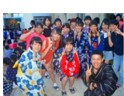
▲浴衣姿も多い夜後祭と恒例の打上げ花火