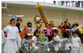
▲パレマス…1位:3の4「ライオンキング」(左)、全員集合(右)