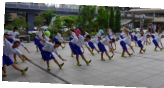
▲長野駅前での1年スポ科のパフォーマンス