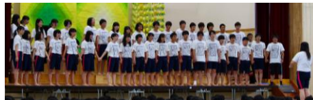
▲合唱祭…最優秀賞:3の4「予感」(アンコール演奏)