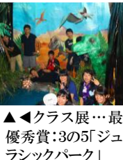
▲◀クラス展…最優秀賞:3の5「ジュラシックパーク」