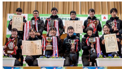
地元インターハイで男女優勝(H3)