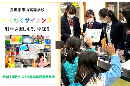
SSH サイエンスフェスタ(R3)