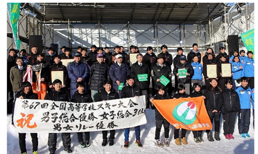
飯山雪まつりにて総合優勝報告会(H30)