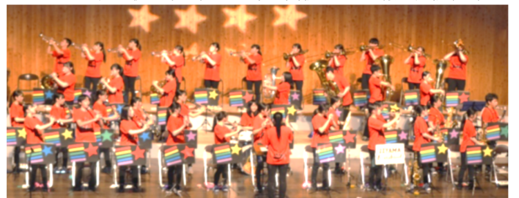
吹奏楽部の定期コンサート(R4)