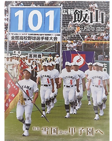
甲子園初出場、市報の表紙(R1)