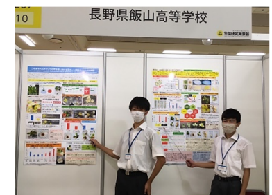
SSH 全国生徒課題研究発表会(R4)