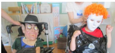
小学部は子どもたちの興味関心をもとにした体験活動を行いました