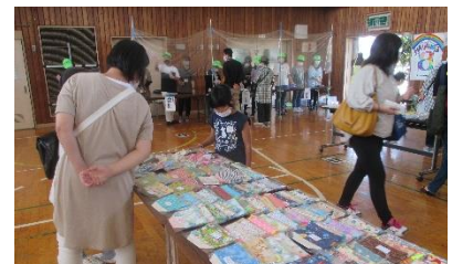
中学部・高等部は感染対策をとって販売活動を行いました