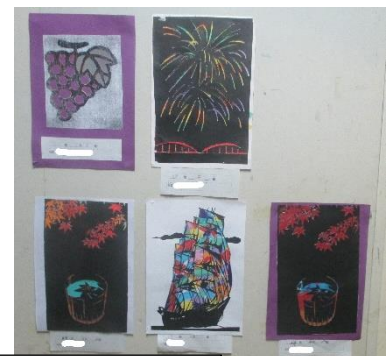
一人ひとりが自分と向き合って作成した作品も目を見張る素晴らしさです