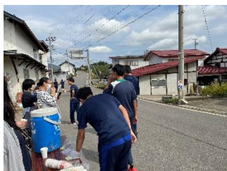
(左上) 保護者の皆さんのサポート&声援に背中を押されて頑張りました。役員以外の保護者の方からも、たくさん声援をいただきました。

過ごしやすい秋の気候の中、51回を数える伝統の開校マラソンが開催されました。保護者の方々や地域の方々の協力もあり、大きな怪我なく無事に終えることができました。記録を狙う人、完走を目指す人など、個人個人の目標に向かって楽しく走る姿が見られました。