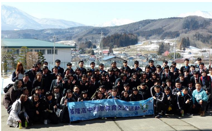
(上) 美しい雪山をバックに、全員で記念撮影。本校2年生の進学コースが対応をさせていただきました。

歓迎セレモニーでは互いの学校を紹介しあい、台湾のみなさんに素敵なダンスと歌を披露していただきました。英語でのコミュニケーションにはなかなか苦戦していた本校生徒も、交流するなかで次第に打ち解け、楽しい時間を過ごさせていただきました。