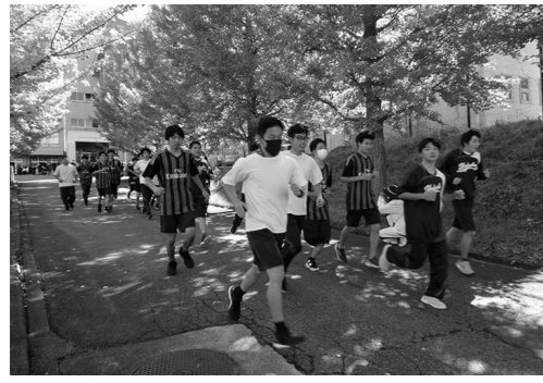
開校マラソン大会

れらを受けて、県教育委員会は二〇二二(令和四)年三月までに「再編・整備計画」(案)を策定し、公表する予定です。(詳細等につきましては、県教育委員会ホームページをご覧ください。) 本校の将来を見据えていく上でも、諸先輩方に築いていただいた伝統を受け継ぎながら、地域に愛される学校を目指し、今後も新しい可能性にチャレンジできる環境を整え、特色を活かす、生徒たちの成長に繋がってほしいと考えております。結びに、皆様の益々のご健勝とご活躍をご祈念申し上げますとともに、引き続き母校へのご支援をお願いし、報告とさせていただきます。