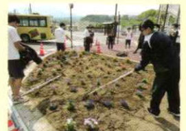
生徒会牟礼駅花壇