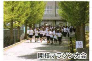
開校マラソン大会