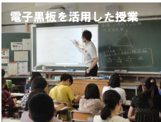
電子黒板を活用した授業