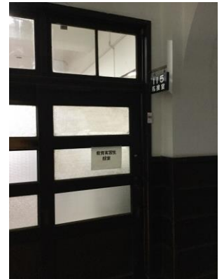
実習生控室は応接室です

今年は 14 名の卒業生が、二週間または三週間の日程で教育実習を行っています。久しぶりの母校に緊張気味の実習生に対して、初日の冒頭で校長から激励をしました。 若々しい感性 で、一生懸命授業をして、ホームルームや放課後は大学生活の様子とか、自分の高校生活とかの経験談を話してあげてほしい、教育実習にきた大学生の先輩から受ける影響は決して小さくないですよ、というような内容です。昨年は 13 名の実習生がいましたが、長野県の高校の教員になったのは (多分) 1 名でした。教育は未来を創る大切な営みです。一人でも多くの本校卒業生が教員を目指してくれることを心から期待します。