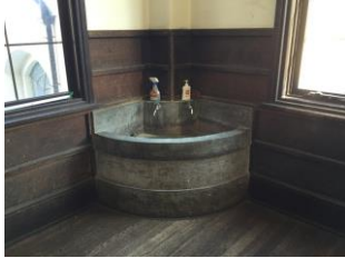
冬期間は水が出ません…

国の登録有形文化財に指定されている1棟は、昭和10年の落成当時の佇まいで、木のぬくもりの中に歴史と伝統がたくさん詰まっています。趣のある風格を湛えています。実際に生活する者にとっては大変な面もあります。夏暑く、冬