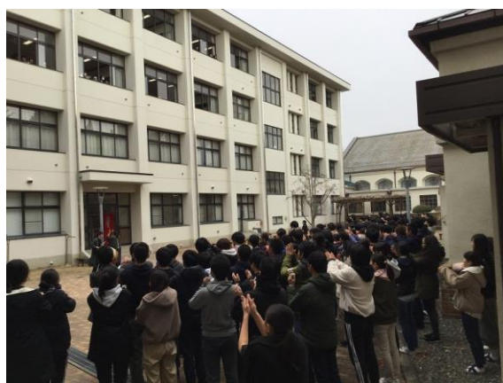
センター壮行会(15日昼休み「フレ!フカシ!」)

今年で最後となる大学入試センター試験が、18日から二日間の日程で行われました。1990年に始まったこのセンター試験、次第に私大の利用校が増えて、今年は短大を含め過去最多の858校に上るのだそうです。来年度からは、より思考力を重視されている大学入学共通テストに衣替えするため、今年は安全志向で、浪人を避けるような志願傾向にあるとの分析があります。一方で、難関と呼ばれる大学の志願者が減って、最後まで第一志望を貫けばチャンスが例年より大きくなる、との見方を示した予備校関係者もいました。意志あるところに道は開ける。あまり情報に惑わされずに、自分の将来のために、自分の意志で進むべき道を決めていきましょう。ちなみに来年度実施の大学入学共通テストは根幹の部分が揺らいでいます。昨年の11月に英語における民間資格・検定試験の活用の延期が決まり、12月には、国語と数学への記述式問題の導入を見送ることが発表になりました。これで、センター試験との大きな違いであった二つの柱は、どちらも消えることとなります。前日に雪の予報が出て、ちょっと心配させられましたが、幸い初日は薄曇り。寒さも例年並みで、天候と交通による影響はなく、落ち