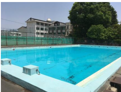
プールが満水になりました（5月15日）

絶えず努力をしない限り習慣に流される。」と言っています。優先順位、オン・オフの切り替え、隙間時間と少しの努力の習慣化、集中力。「切り替え」と「集中」を行いながら、時間をうまくつかっていくこと、タイムマネジメントの力を培うことは、深志生がさらに底力を発揮していくための大事な課題だと思います。