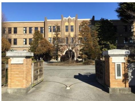
2020年(令和2年)1月1日午前10時

2020年の元日の松本は雲一つない快晴、穏やかな年明けとなりました。昨年も比較的天候に恵まれた年始でしたが、10月に台風19号が襲来し甚大な被害の爪痕を残しました。今年は大きな災害のない一年となることを心から願いたいと思います。1日の学校では、男子バスケットボール部のOB会が大体育館で行われていて、現役を含めた50名を超える皆さんが、楽しそうにバスケットを楽しんでいました。3年生は18日からセンター試験が行われるため、お正月気分もそこそこに、最後の追い込みの勉強に励んだ休みになったことでしょう。冬来りなば春遠からじ、辛く苦しい時期を