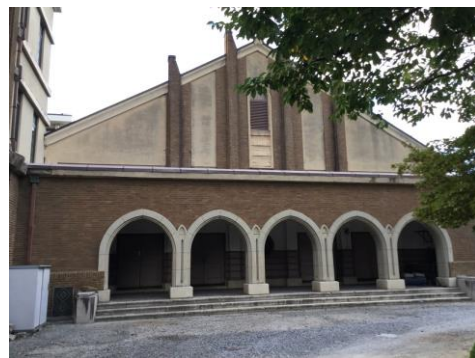
講堂前は撤収、以前の景観に戻りました

した。1棟も残暑に間に合い、体験入学でも大いに威力を発揮してもらいました。業者の皆さんのご尽力に心から感謝いたします。