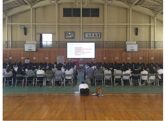
保護者・引率者対象の説明会（大体育館は暑かった…）

今年の体験入学は、昨年度までの体験授業中心のプログラムから内容を見直しました。本校の授業を実際に体験してもらうことは、中学生にとっては大変意義深いことだと考えていましたが、一方で深志の日常、一日の学校生活の様子や生徒会活動、部活動、校風といったものを、実際の生徒の視点と言葉で伝える時間が限られてしまう、といったデメリットもありました。そこで今年度は思い切って授業をやめて、生徒主体の内容に全面的に変えてみました。コンセプトは、「深志の、今を聴き、今に答え、今を伝える」。生徒とともに中身を検