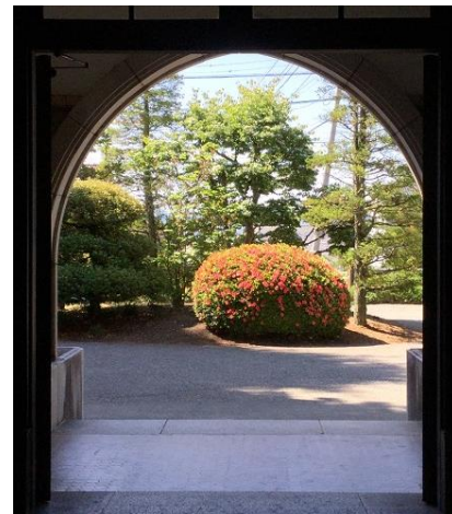
正面玄関前のサツキ（ツツジ?）

★ 期末考査一週間前となり、クラブ活動は原則禁止、放課後は静かな学校になります。教室や自習室で勉強している生徒の数も日毎に多くなりました。とんぼ祭を前に、さしずめ嵐の前の静けさのようです。