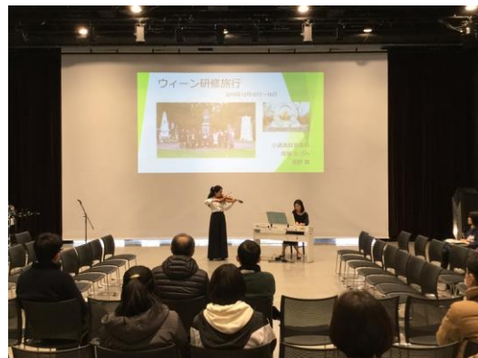
小諸高校音楽科ウィーン研修報告&ミニコン

「外へのグローバル化」に向き合わざるを得ません。一方、日本においても「内なるグローバル化」が進みます。15 歳以上 64 歳未満の人口を生産年齢人口といいますが、2010 年に 8137 万人いた生産年齢人口は、50 年後の 2060 年には何と半分の 4418 万人になります。確かに AI は発展するし、今以上に高齢者や女性の労働市場への進出は進むとしても、現役世代の労働力不足は深刻な問題になり、外国人の労働力が間違いなく今以上に必要にされるでしょう。移民の問題にどう向き合うか、日本は真剣に向き合わざるをえない時代はもうすぐそこまで来ています。こうしたグローバル化という大きな流れの中で、自分の育ってきた環境とは違う 多様で異質な他者 を受け入れ、自分の考えを発信し理解させられる力が必要になります。そしてそのためには、できるだけ感性の豊かな 10 代のときに、自分とは異なる多様で異質な他者に出会うことが重要だと思います。「留学」はそのための一つの大きな手段ですね。現状、高校生にとって留学は経済面や語学の壁に加えて海外生活への不安も多く、積極的になれない事情もあります。そんな高校生を資金面や留学内容から支援し、留学へ踏み出す一歩を応援するのが県教委の「信州つばさプロジェクト」事業です。今回のフェアは信州の高校生の留学気運を高めることを目的に、高校生が企画・運営する初めての留学イベントとして行われ、本校の保護者の方もお見えになっていました。ちなみに現在本校では、ドイツ留学中の生徒が 1 人、アメリカからの留